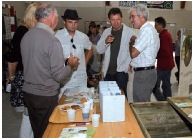
Les élus sensibilisent les habitants au tri et au compostage.

De nombreux habitants de la commune et hors commune ont été sensibles au tri des déchets verts.